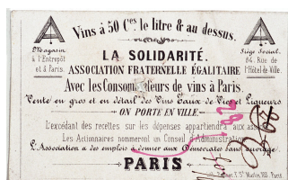
Carte de La Solidarité, association fraternelle et égalitaire avec les consommateurs de vins à Paris