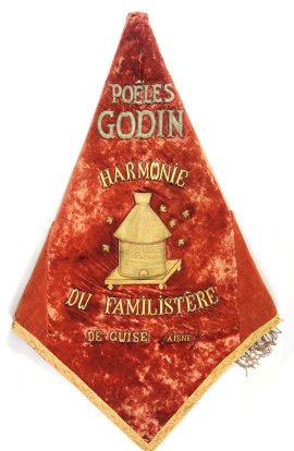
La bannière de l'harmonie du Familistère