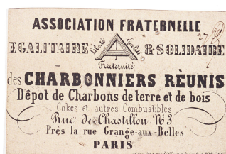
Carte de l'Association fraternelle, égalitaire et solidaire des charbonniers réunis

Notice créée le 14/05/2018. Dernière modification le 19/06/2018.