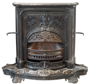
Cheminée n° 28 A