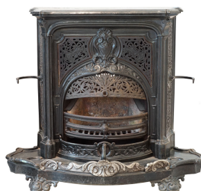
Cheminée n° 28 A