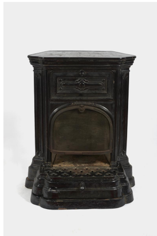
Cheminée n° 47