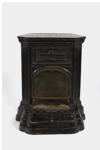
Cheminée n° 47