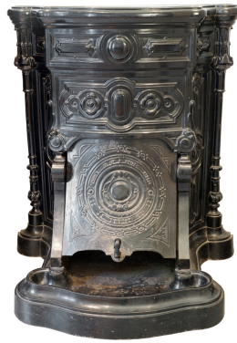
Cheminée n° 9