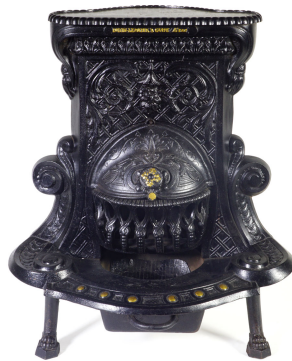
Cheminée n° 40