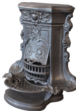
Cheminée n° 20