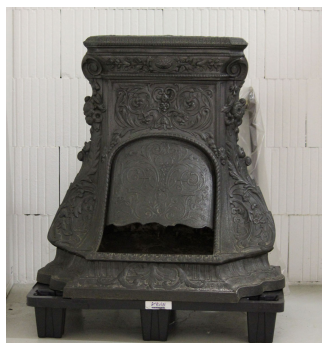
Cheminée n° 19

Notice créée le 27/04/2020. Dernière modification le 10/06/2020.