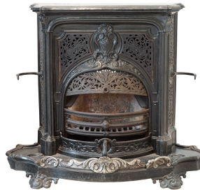
Cheminée n° 28 A