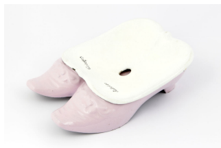
Crachoir n° 29

Album de 1887 des Fonderies et manufactures Godin-Lemaire (p. 215). Collection Familistère de Guise (inv. n° 1999-9-078).