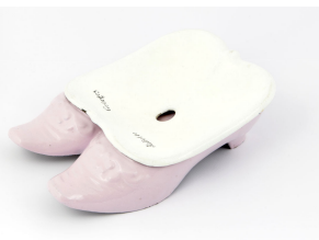
Crachoir n° 29

Album de 1914 de la Société du Familistère de Guise (p. 446-447). Collection Familistère de Guise (inv. n° 1999-9-68).