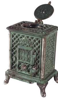
Encrier « Radiolette » n° 16

Bibliographie : Album général d'août 1880 des fonderies et manufactures de la Société du Familistère de Guise Godin & C ie , Guise, Imprimerie Baré, 1880, p. 84.