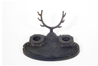
Encrier n° 2

Notice créée le 28/04/2020. Dernière modification le 29/05/2020.