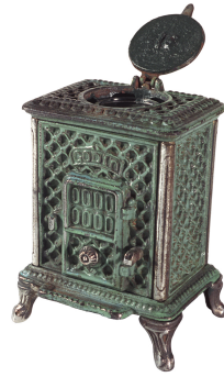
Encrier « Radiolette » n° 16