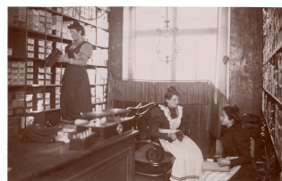
Le rayon des chaussures dans la mercerie du Familistère de Guise

Notice créée le 27/08/2018. Dernière modification le 27/08/2022.