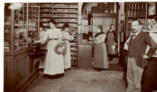
Le dépôt de pain dans l'épicerie du Familistère de Guise