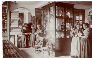
La mercerie du Familistère de Guise