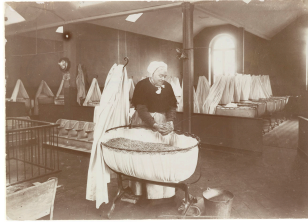
Préparation d'un berceau de la nourricerie du Familistère