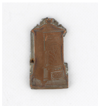
Matrice de gravure : Calorifère n° 2130 à dessus