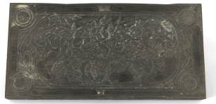
Matrice de gravure : Ornement végétal