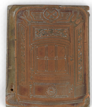
Matrice de gravure : Foyer hygiénique n° 2346