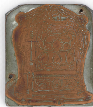
Matrice de gravure : Foyer hygiénique n° 334-336, n° 2336