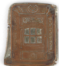
Matrice de gravure : Foyer hygiénique n° 2346