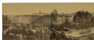
Le Palais social vu du jardin d'agrément