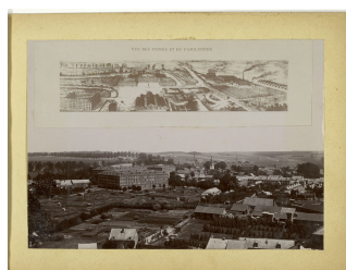
Panorama du Familistère de Guise

Notice créée le 13/10/2018. Dernière modification le 30/10/2018.