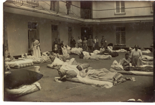
Soldats blessés dans la cour du pavillon central du Familistère de Guise