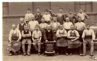
Un groupe d'ouvriers de l'atelier d'ajustage de