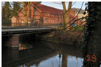
La buanderie-piscine du Familistère vue de la rive gauche de l'Oise. Photographie Hugues Fontaine, 2002.

ACCUEIL DE GUISE DÉCOUVRIR LA BUANDERIE-PISCINE UNE ARCHITECTURE AU SERVICE DU PEUPLE LE FAMILISTÈRE