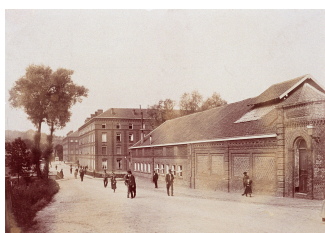
La façade sur rue de la buanderie-piscine du Familistère. Photographie Marie-Jeanne Dallet-Prudhommeaux, vers 1897. Collection Familistère de Guise.