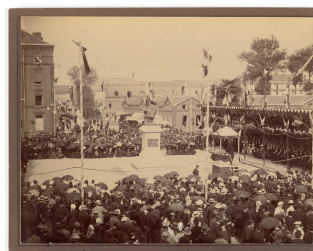
Cérémonie d'inauguration du monument à Godin sur la place du Familistère

Notice créée le 18/10/2018. Dernière modification le 30/10/2018.