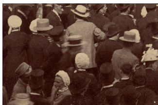
Cérémonie d'inauguration du monument à Godin sur la place du Familistère.