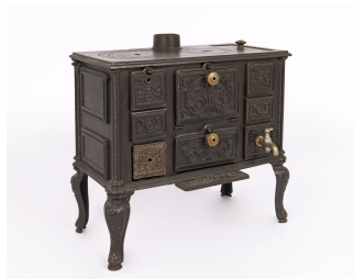
Cuisinière jouet n° 405