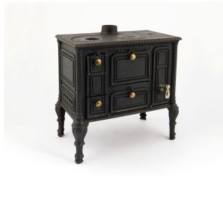
Cuisinière jouet n° 1