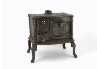
Cuisinière jouet n° 564