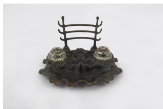
Encrier n° 1

Les modèles d'encriers n° 1 à 9 dans l' Album général d'août 1880 de la Société du Familistère de Guise , p. 84. Coll. Familistère de Guise (inv. n° 1999-9-76).