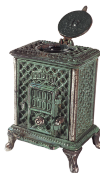
Encrier « Radiolette » n° 16

Bibliographie : Album général d'août 1880 des fonderies et manufactures de la Société du Familistère de Guise Godin & C ie , Guise, Imprimerie Baré, 1880, p. 84.