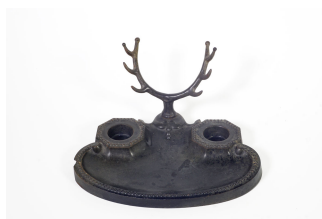
Encrier n° 2

Notice créée le 28/04/2020. Dernière modification le 29/05/2020.