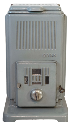
Foyer hygiénique n° 404

Les foyers hygiéniques dans le catalogue Modèles de vente courante et créations récentes 1937-1938 de la Société du Familistère. Coll. Familistère de Guise (inv. n° 1999-9-73).