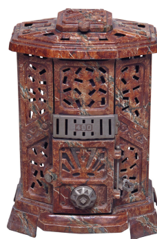
Foyer hygiénique « Godinette » n° 400

Les foyers hygiéniques dans le catalogue Modèles de vente courante et créations récentes 1937-1938 de la Société du Familistère. Coll. Familistère de Guise (inv. n° 1999-9-73).