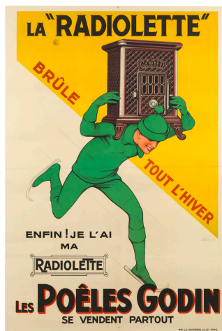
Affiche « La Radiolette brûle tout l'hiver »

Sources et bibliographie : Album de reconstitution n° 5 de la Société du Familistère de Guise Colin & C ie . Mai 1925, 1925, p. 16.