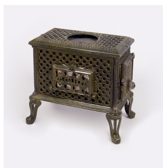
« Chauffette » n° 299