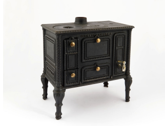
Cuisinière jouet n° 1