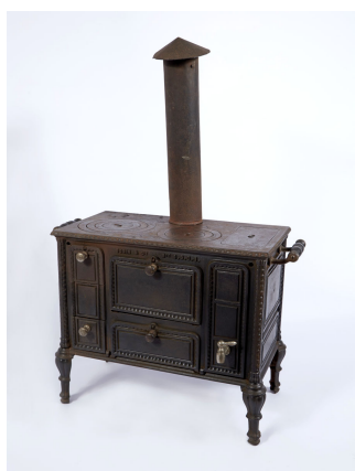
Cuisinière jouet n° 4