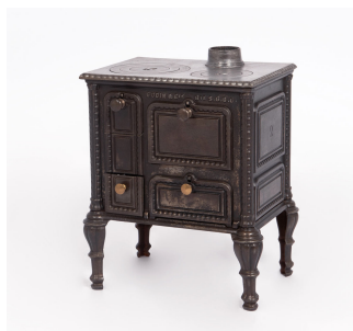
Cuisinière jouet n° 2