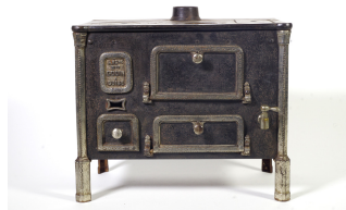
Cuisinière jouet n° 7

Bibliographie : Album général des appareils de cuisine, chauffage et bâtiment de la Société du Familistère Colin & C ie . Mars 1903, Saint-Étienne, Imprimerie A. Waton, 1903, p. 256.