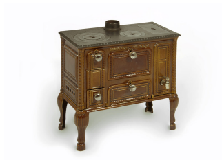
Cuisinière jouet n° 3