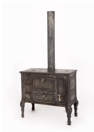
Cuisinière jouet n° 3