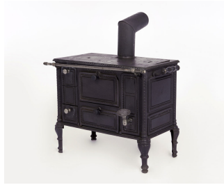
Cuisinière jouet n° 4