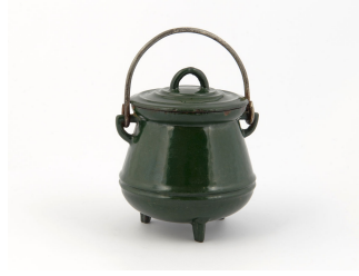
Pot de Hainaut jouet

Notice créée le 27/05/2019. Dernière modification le 12/05/2023.