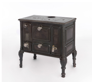
Cuisinière jouet n° 1