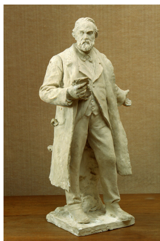
Modèle de la statue de Jean-Baptiste André Godin

enfant ; ouvrier ; statue ; place du Familistère de Guise ; monument à Godin ; bicyclette