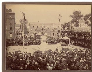
Cérémonie d'inauguration du monument à Godin sur la place du Familistère