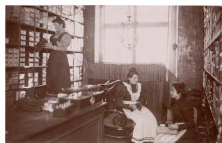
Le rayon des chaussures dans la mercerie du Familistère de Guise

Notice créée le 27/08/2018. Dernière modification le 27/08/2022.