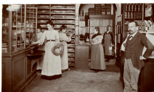
Le dépôt de pain dans l'épicerie du Familistère de Guise