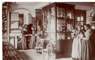
La mercerie du Familistère de Guise