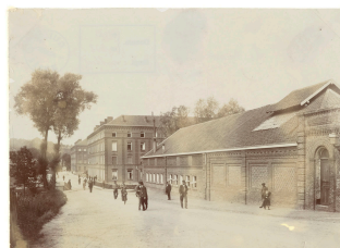
La buanderie-piscine du Familistère