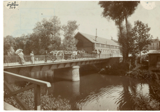
Le pont sur l'Oise du Familistère de Guise