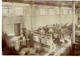
La buanderie du Familistère