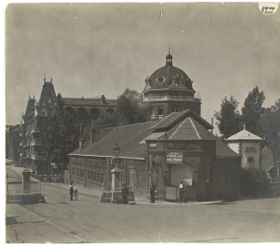
La buanderie-piscine et l'aile gauche du Familistère

Notice créée le 19/07/2018. Dernière modification le 27/08/2022.