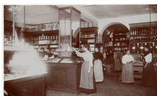
L'épicerie du Familistère de Guise