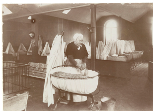
Préparation d'un berceau de la nourricerie du Familistère