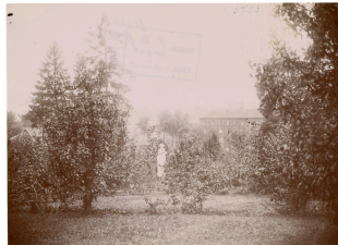
Le jardin d'agrément du Familistère de Guise

Notice créée le 26/10/2018. Dernière modification le 27/08/2022.