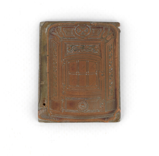
Matrice de gravure : Foyer hygiénique n° 2346