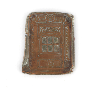
Matrice de gravure : Foyer hygiénique n° 2346