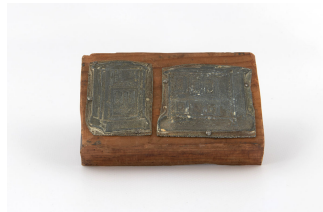
Matrice de gravure : Foyer hygiénique n° 411-412. Cuisinière n° 956-958