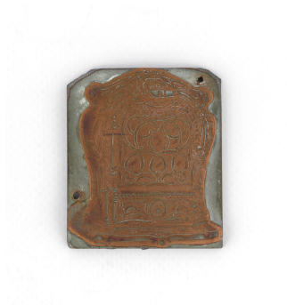
Matrice de gravure : Foyer hygiénique n° 334-336, n° 2336