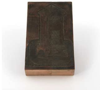
Matrice de gravure : Calorifère à feu continu n° 164-168