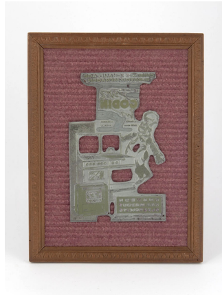
Matrice de gravure : Affichette publicitaire Godin « Cuisine-Chauffage. Électro-ménager »