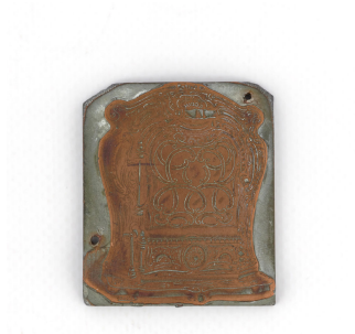
Matrice de gravure : Foyer hygiénique n° 334-336, n° 2336