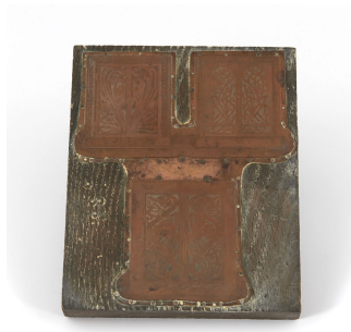
Matrice de gravure : Foyers économiques « Diable » n° 170-173, n° 170-172 B et n° 173 B