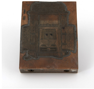
Matrice de gravure : Calorifère-buffet à feu intermittent n° 31-33