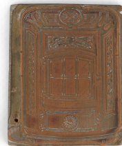
Matrice de gravure : Foyer hygiénique n° 2346