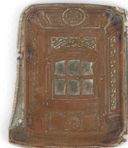
Matrice de gravure : Foyer hygiénique n° 2346