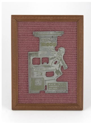
Matrice de gravure : Affichette publicitaire Godin « Cuisine-Chauffage. Electro-ménager »