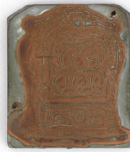
Matrice de gravure : Foyer hygiénique n° 334-336, n° 2336