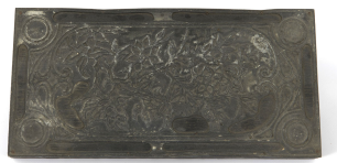
Matrice de gravure : Ornement végétal