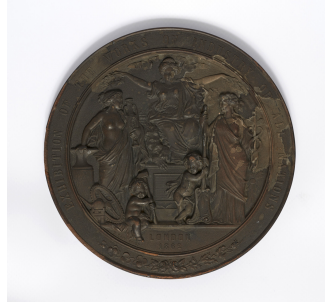
Médaille commémorative de l'Exposition universelle de 1862 à Londres

Notice créée le 12/05/2019. Dernière modification le 13/05/2019.