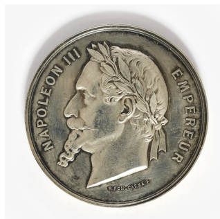
Médaille d'argent de l'Exposition universelle de 1867 à Paris