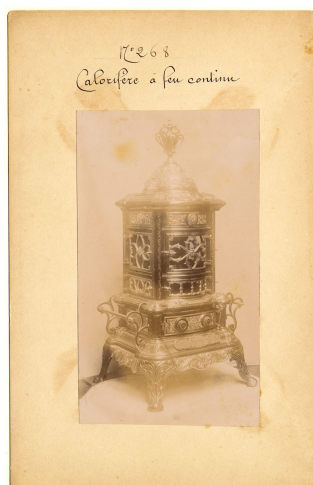
modèle n° 268 des calorifères à feu continu et visible n° 153 à 155