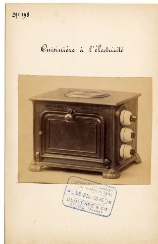
modèle n° 198 d'une cuisinière à l'électricité