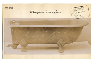
modèle n° 258 d'une baignoire de forme anglaise