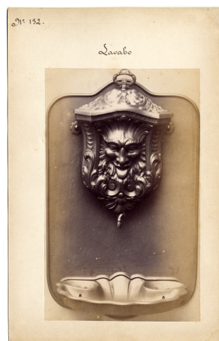
modèle n° 152 du lavabo-fontaine n° 11

article de quincaillerie ; porte-parapluies ; rinceaux