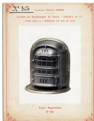
modèle n° 360 du foyer hygiénique n° 340