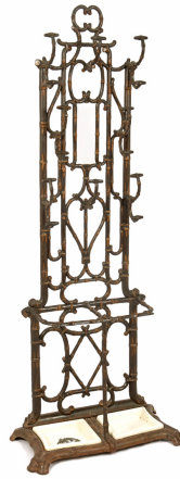
Porte-parapluie n° 10

Notice créée le 24/04/2018. Dernière modification le 30/04/2019.