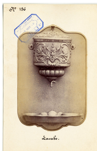
modèle n° 136 du lavabo-fontaine n° 10