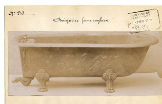
modèle n° 258 d'une baignoire de forme anglaise