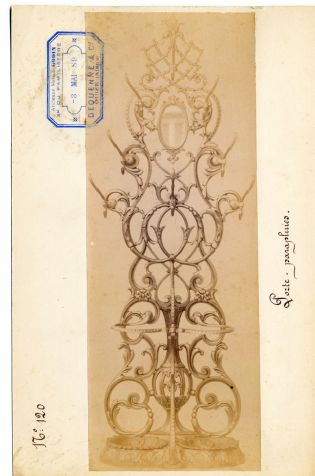
modèle n° 120 du porte-parapluies n° 9