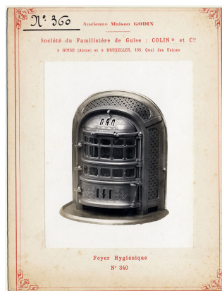
modèle n° 360 du foyer hygiénique n° 340