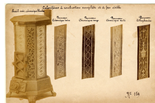
Modèle n° 159 de calorifères à combustion complète et à feu visible

Notice créée le 24/04/2018. Dernière modification le 13/06/2018.