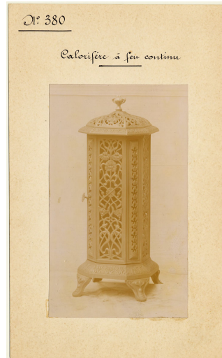
modèle n° 380 d'un calorifère à feu continu