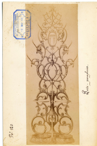
modèle n° 120 du porte-parapluies n° 9