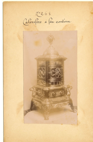
modèle n° 268 des calorifères à feu continu et visible n° 153 à 155