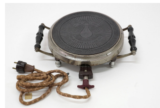
Chauffe-plat électrique n° 2