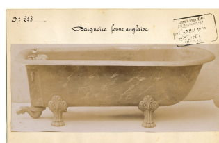
modèle n° 258 d'une baignoire de forme anglaise