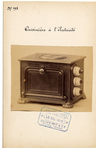
modèle n° 198 d'une cuisinière à l'électricité