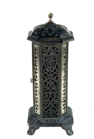
Calorifère à feu continu n° 431