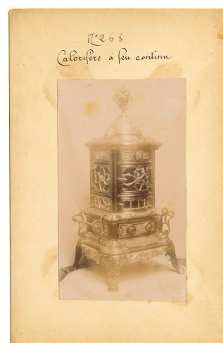
modèle n° 268 des calorifères à feu continu et visible n° 153 à 155