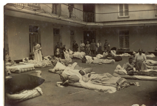
Soldats blessés dans la cour du pavillon central du Familistère de Guise