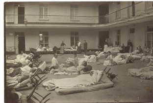
Soldats blessés dans la cour du pavillon central du Familistère de Guise