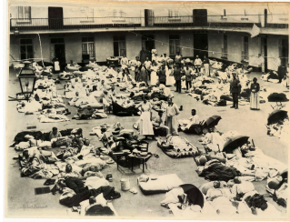
Soldats blessés dans la cour du pavillon central du Familistère de Guise

Notice créée le 02/10/2018. Dernière modification le 08/11/2018.