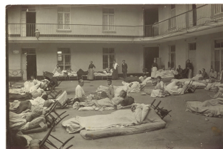
Soldats blessés dans la cour du pavillon central du Familistère de Guise