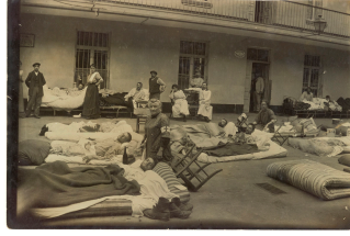
Soldats blessés dans la cour du pavillon central du Familistère de Guise