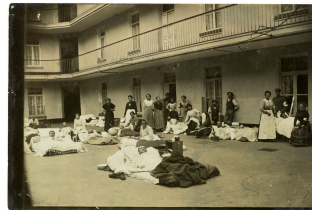
Soldats blessés dans la cour du pavillon central du Familistère de Guise