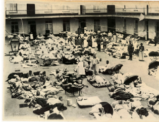
Soldats blessés dans la cour du pavillon central du Familistère de Guise

Notice créée le 03/10/2018. Dernière modification le 08/11/2018.