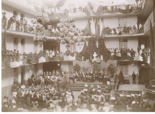
La cour intérieure de l'habitation du Familistère de Laeken, à l'occasion de la fête de l'Enfance. Photographie Marie-Jeanne Dallet-Prudhommeaux, septembre 1898. Collection Familistère de Guise.