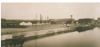
Le Familistère de Laeken le long du quai du canal de Willebroek.

Guise. Pour accéder à la qualité de sociétaire ou d'associé, les travailleurs doivent, selon les statuts de l'Association, « habiter le Familistère ». Encore faut-il disposer d'un palais sociétaire. Pour que les travailleurs belges appartiennent pleinement à l'Association, il est nécessaire de bâtir une habitation à Laeken. Godin en forme le projet en 1883, au moment où s'achève à Guise le dernier grand chantier du Familistère, la construction du pavillon Cambrai.