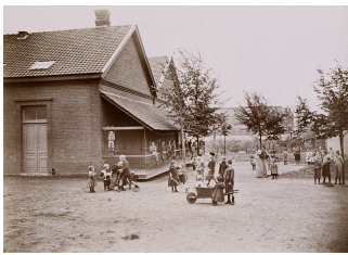
L'école du Familistère de Laeken. Photographie Marie-Jeanne Dallet-Prudhommeaux, septembre 1898. Collection Familistère de Guise.