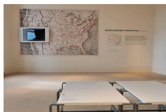
Godin et l'aventure du Texas : salle d'exposition au rez-de-chaussée de l'aile droite du Palais social.

Il n'y a pas de château de « patron » au Familistère. Le fondateur habite au Palais social parmi les travailleurs. Il loge d'abord dans l'aile gauche. Godin et Marie Moret emménagent au premier étage de l'aile droite après l'achèvement de celle-ci en 1878. L'appartement et les logements du rez-de-chaussée sont aujourd'hui consacrés au personnage de Godin.