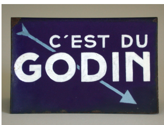
Plaque publicitaire. Tôle émaillée, deuxième quart du XX e siècle.