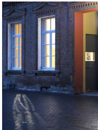
L'entrée de l'appartement de Godin.

ACCUEIL VISITER QUE VOIR, QUE FAIRE AU FAMILISTÈRE ? LE MUSÉE DE SITE L'APPARTEMENT DE GODIN