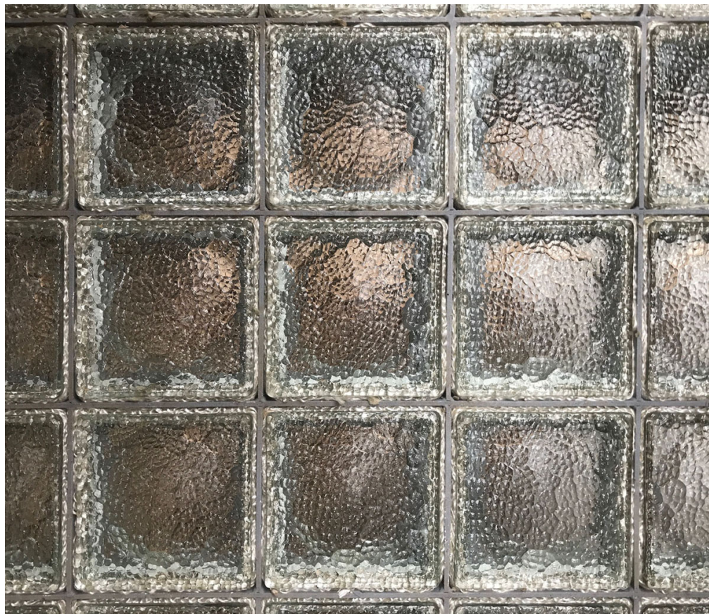
Pavés de verre sur une galerie de l'aile gauche du Palais social. Photographie Familistère de Guise, 2019.

permanence ! C'est très inconfortable, même s'il porte des genouillères et se tient sur un bloc de mousse. Plus ou moins cent pavés sont posés par jour, soit trois à quatre mètres linéaires de coursive. De semaine en semaine, l'avancée est remarquable. En totalité, près de 7 500 pavés seront utilisés pour recouvrir le sol des trois niveaux de galeries de la cour intérieure.