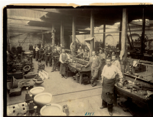
Les ajusteurs de l'atelier de quincaillerie de l'usine du Familistère