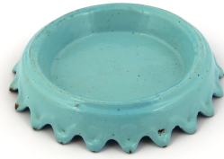
Crachoir n° 11