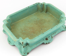
Crachoir n° 1