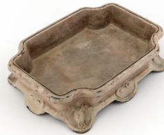
Crachoir n° 2